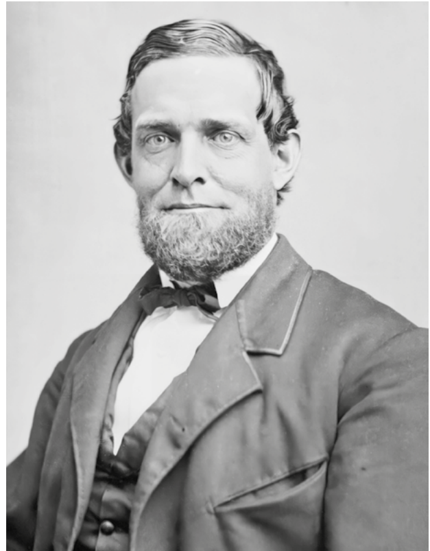
Schuyler Colfax var upphafsmaður þess að konur fengu inngöngu í Oddfellow árið 1851.

Rebekkunafnið sótti Colfax úr Biblíunni. Þar segir frá Abraham og Söru, konu hans, sem áttu soninn Ísak. Þegar Sara lést sendi Abraham þjón sinn Eliezer með marga úlfalda og dýrgripa til að leita að konu fyrir Ísak. Þegar hann kom eftir langt ferðalag til borgarinnar Nahor í Mesópótamíu bað hann Guð að hjálpa sér að finna konuna fyrir Ísak. Birtist þá ung kona að nafni Rebekka við brunninn og brynnti þyrstum þjóninum og úlföldum hans. Eliezer fékk hana til að ganga til fundar við Ísak. Tókust ástir með þeim í kjölfarið og Ísak lét huggast eftir móðurmissinn.