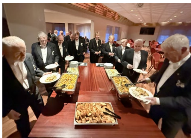
Gengið að veisluborði en matur er nú framleiddur í nýju og glæsilegu eldhúsi.

mönnum í stúkunum ásamt aðstoðarmönnum eins og þörf var á hverju sinni. Einnig var keypt að vinna verktaka svo sem við steypusögun, múrbrot og múrverk. Mikilvægur áfangi náðist þegar gólf í veislusal og eldhúsi voru steypð þann 9. júlí sl.