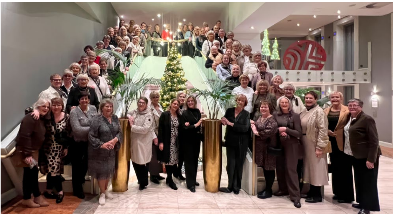
Fríður hópur matriarka í Karítas á hótelinu í Brussel, tilbúnar að fara saman út að borða.

Um kvöldið voru aftur veisluhöld og nú í gamalli bankahvelfingu rétt hjá Grand Plaza, sem heitir Belga Queen . Við matriarkar fengum privat bankahvelfingu fyrir okkur – í orðsins fyllstu og gæddum okkur á humri, kjúklingi og ís með belgísku súkkulaði og þeyttum rjóma – eftirréttur sem bragðlaukarnir gleyma aldrei!