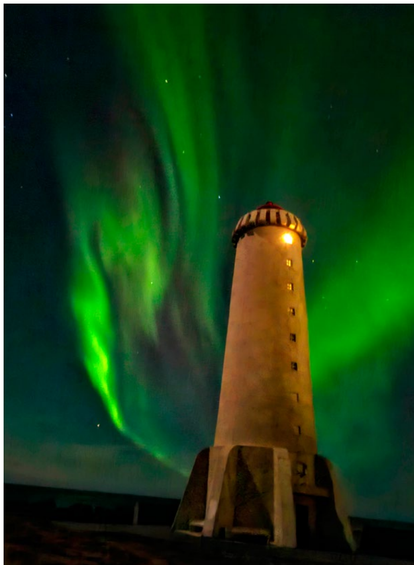
Akranesvitinn er tákn stúkunnar Egils.

Höfuðmarkmið starfsins er að styrkja þurfandi. Koma þann veg góðu einu til leiðar fyrir samfélagið. Og fundirnir verða gefandi og gleðjandi enda eru grunngildin þar varin. Að gefa án þess að miklast af því eða vænta þakklætis á strætum úti er sú gjöf er gleður kyrrlátan huga. Minnumst þess að gjöf er svo lengi gjöf að eigi sé vænst gjafar á móti. Gerist