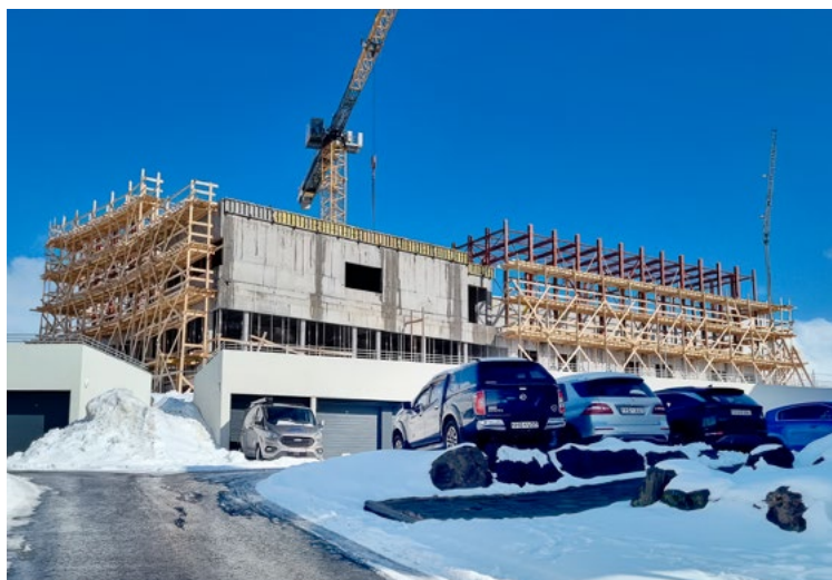
Oddfellowhúsið á Urriðaholti ris hratt og er farið að taka á sig áberandi svip efst á holtinu. Myndin er tekin í byrjun aprílmánaðar.