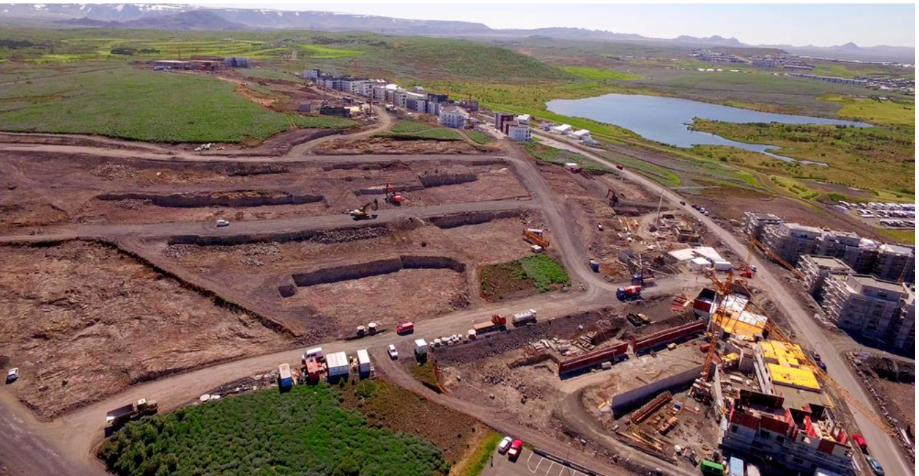
Loftmynd af norðurhluta holtisins árið 2016.