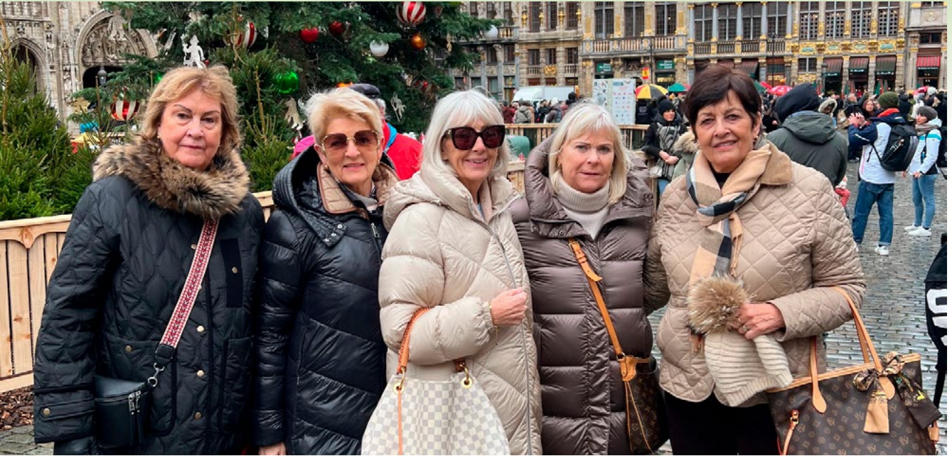
Matriarkar notuðu tækifærið og kaktu á jólamarkaðinn í Brussel.