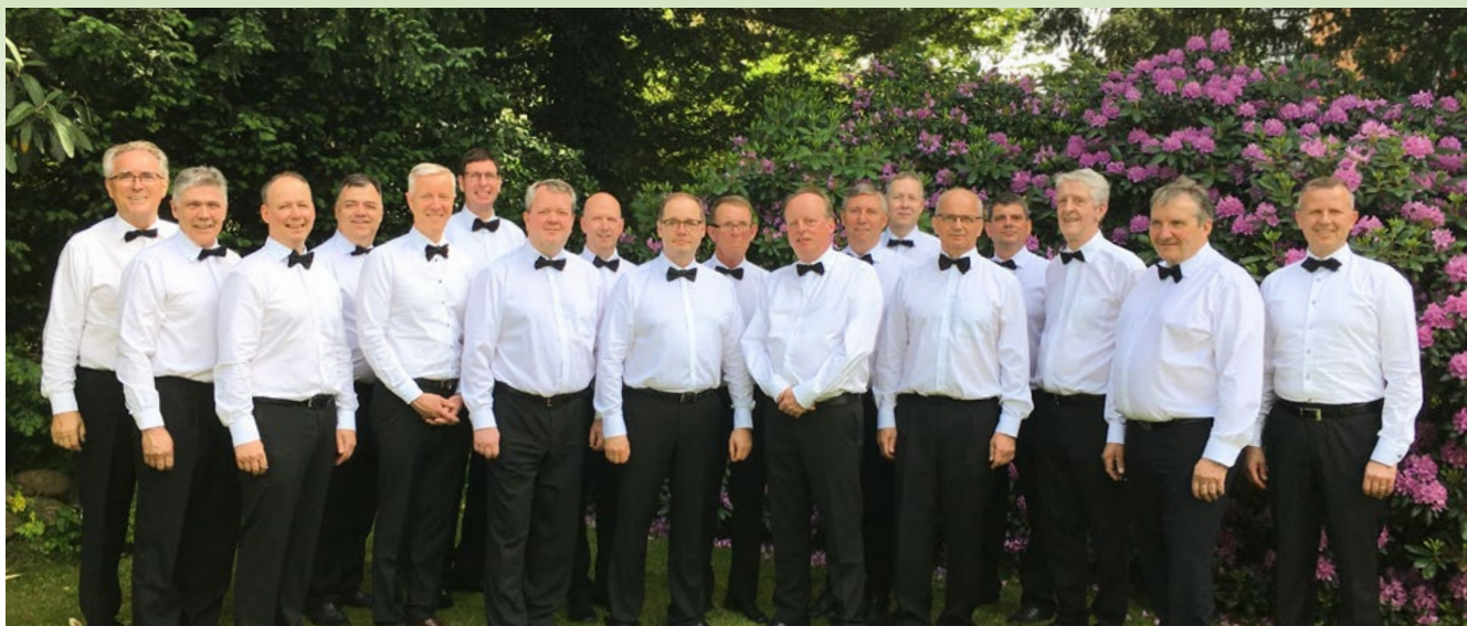
Hallveigarsynir uppáklæddir í garði íslenska sendiráðsins í Kaupmannahöfn, er kórinn var þar á söngferðalagi.