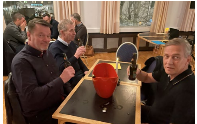
Þorgeirsbræður hita hér upp fyrir spurningakeppnina.