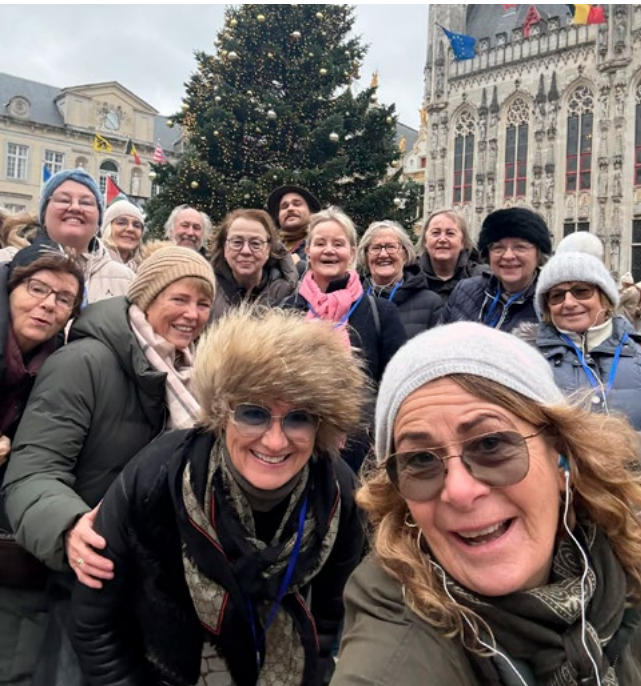
Auðvitað var tekin ein góð sjálfa á jólamarkaðnum.