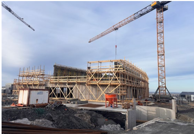
Svona var staðan á verkinu í lok febrúar og verktakar hafa ekki látið vetrarveður aftra sér.

Um miðjan mars var unnið að því að fá verktaka til að sjá um gluggaísetningu og uppsetningu klæðningar, en það voru næstu verkþættir eftir uppsteypuna en Tildra á að ljúka sínu uppsteypuverki nú fyrri hluta sumars. Þá er unnið að því að fullhanna lóðina en stefnt hefur verið að því að einfalda þá hönnun nokkuð frá upphaflegu verðlauna tillögunni.