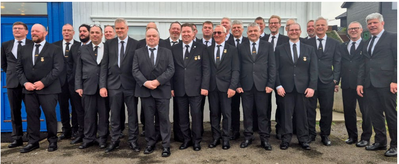
Austfirskir og færeyskir Oddfellowbræður fyrir utan Oddfellowhúsið í Þórshöfn.

Á leið okkar til baka á hóteli var skoðunarferð haldið áfram og meðal annars komið við í Kirkjubæ. Þetta laugardagskvöld var svo kvöldverður á Katarina Christiansen sem var alveg úr efstu hillunni. Aldeilis frábær kvöldverður og topp þjónusta og