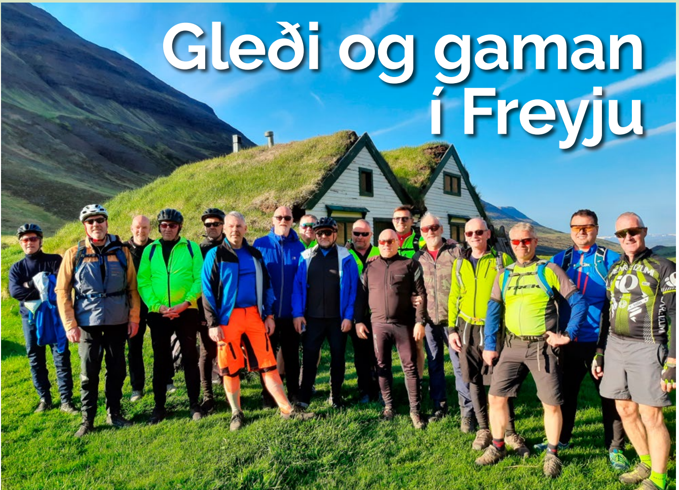
Vaskir Freyjubræður við torfbæinn að Baugaseli í Barkárdal.

M aður er manns gaman eins og oft er sagt. Það á sannarlega við um okkur reglusystkin sem hittumst reglulega, njótum góðrar samveru og látum gott af okkur leiða í okkar frábæra starfi innan Oddfellowreglunnar.