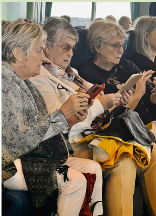
Eins og hver simnotandi tóku þorbjargarsystur upp simana til að stytta sér stundir um borð í Herjólfí.