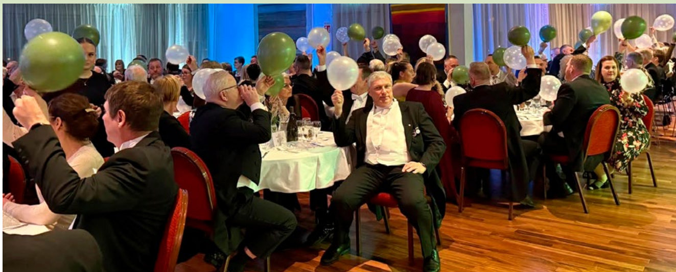
Frá árshátíð í nýjum sal stækkaðs regluheimilis á Akureyri.