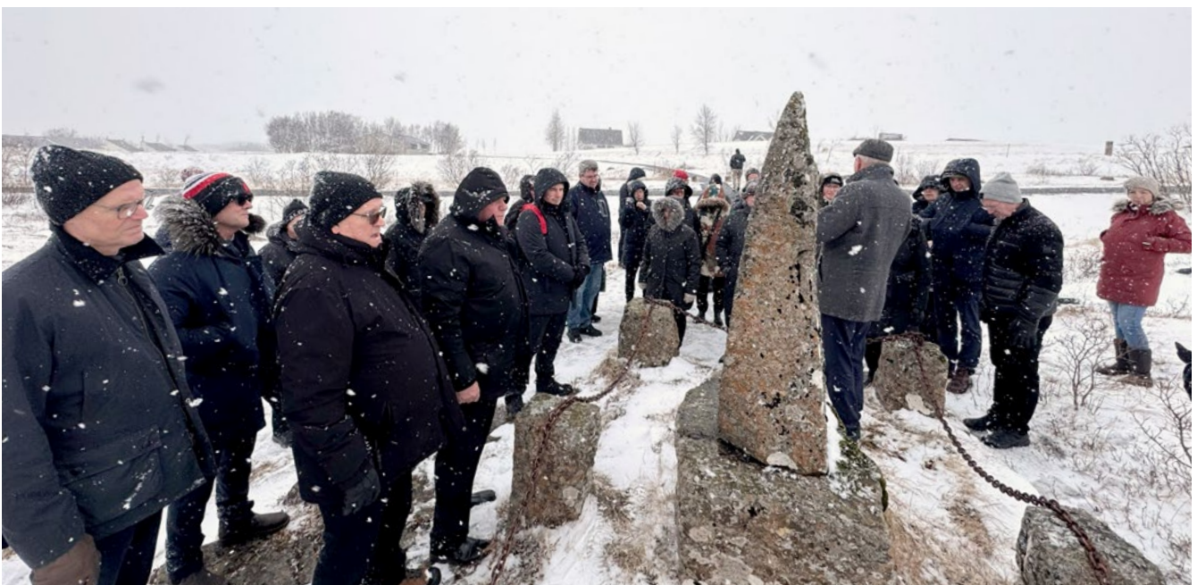
Heldur var hryssingslegt þegar farið var að minnismerkinu um Þorlák helga, sem var biskup í Skálholti á 12. öld.

Höfundur: Viðir Ólafsson, St. nr. 21, Þorláki helga