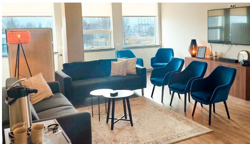
Áð loknum endurbótum er húsnæðið hlýlegt og öll aðstaða til fyrirmyndar.