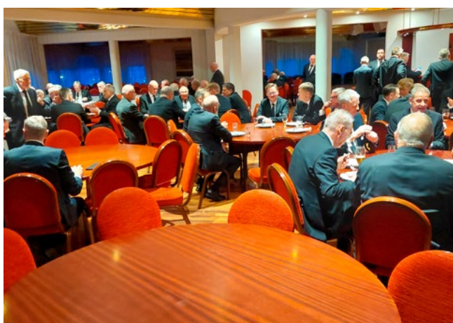
Bætt hefur verið við sal fyrir bræður og systur til að setjast niður fyrir og eftir fundi.