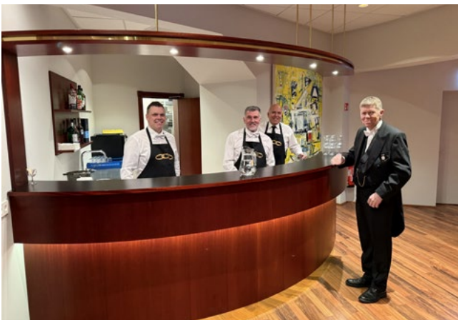
Hressir bræður við barinn í regluheimilinu.

Í lok árs 2024 voru viðbyggingarþættirnir orðnir fokheldir. Á fyrstu mánuðum ársins 2025 var lokið við að steypa bogavegg fyrir ruslageymslur, steypa