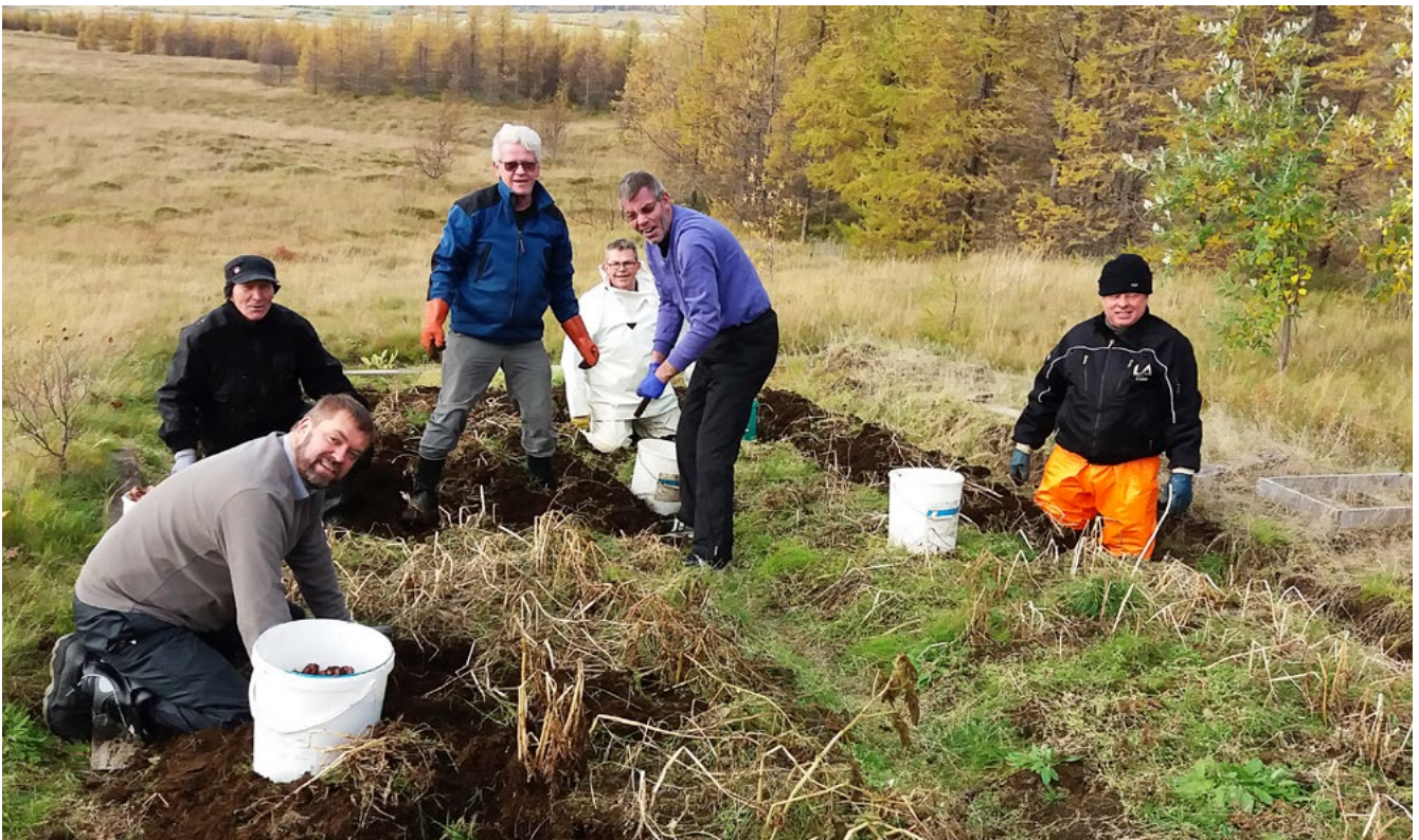
Nokkrir vaskir bræður úr Hrafnkeli Freysgoða við kartöfluupptöku félagsins eitt haustið. Vinnan göfgar manninn, segir máltækid.

Skortir þig sjálfstraust eða færni í samskiptum? Hefur þú ekki orku eða heilsu til að fara út úr húsi? Upplifir þú kvíða í kringum annað fólk? Ef svo er þarf