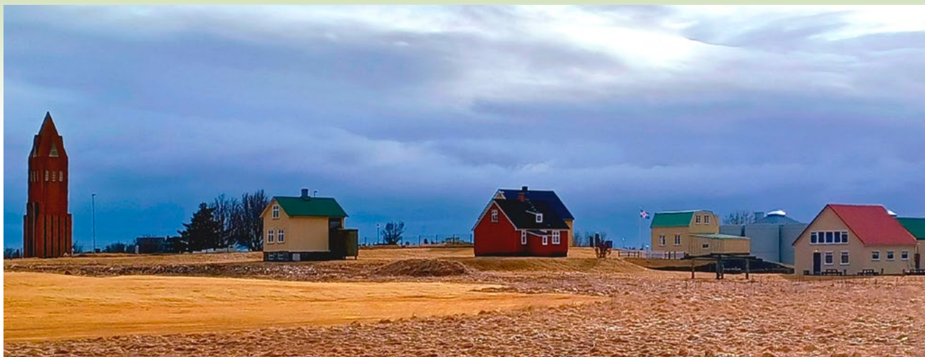
Hús í Byggðasafninu í Gørðum. Lengst til hægri er Templarahúsið, en þar voru stúkufundir Egilsbræðra haldnir í upphafi.

vert að hvíla í þeim friði á meðan fundur varir. Frá því að fyrsti hljómur upphafslags ómar, hefst ferðalag okkar úr amstri daganna inn í frið fundarins.