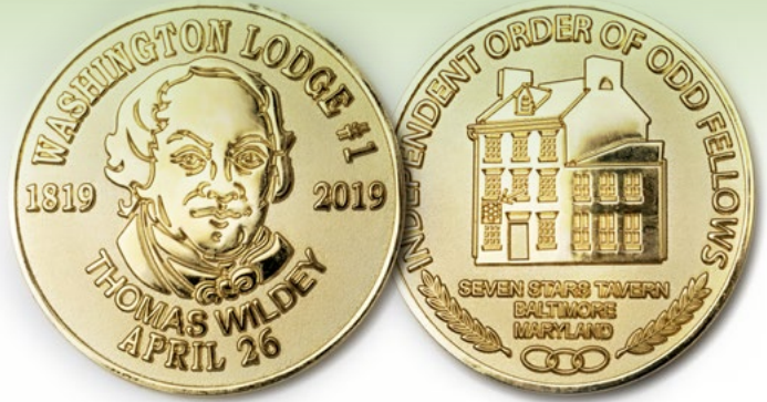
Gullhúðaður minnispeningur sem gefinn var út í tilefni af 200 ára afmæli Oddfellowreglunnar árið 2019. Mynd af Wildey á framhliðinni og fyrsta regluheimilið á bakhliðinni, Sjóstjarnan í Baltimore.

Enginn vafi leikur á að persónuleiki Thomasar Wildey var hrifandi. Hann hafði styrka rödd og þétt