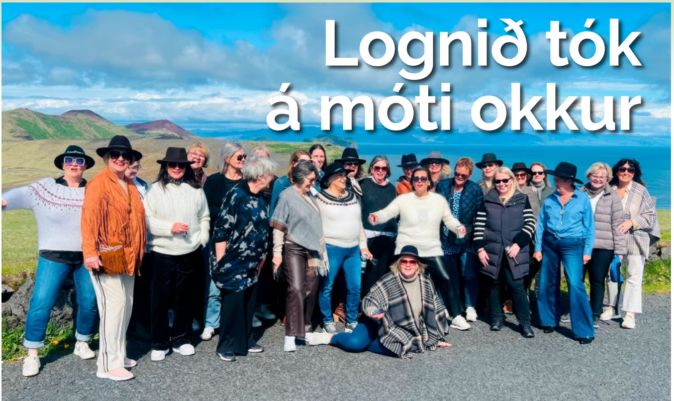
Sannar íslenskar sumarkonur, Þorbjargarsystur, á Stórhöfða, þar sem var stafalogn – svo gott sem!

Á björtum vormorgni í maí 2025 sigldu Þorbjargarsystur loks til Vestmannaeyja. Þetta var önnur tilraun okkar til að komast þangað; árið áður hafði hvassviðrið stöðvað ferðina. Að þessu sinni tók lognið á móti okkur og þegar Heimaey reis úr hafinu blasti við landslag mótað af eldi og sjó — klettaborgir, fuglabjörg og eldfjöll.