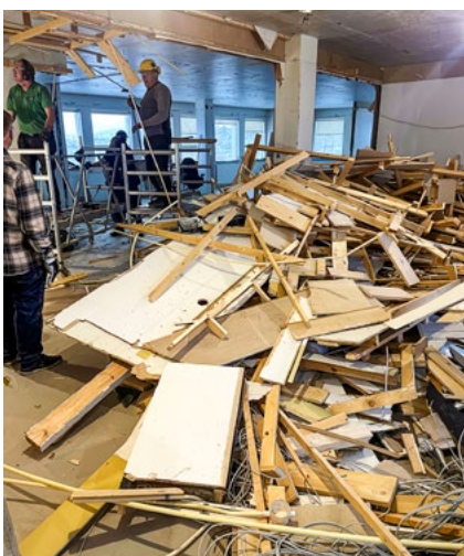
Unnið við niðurrif.