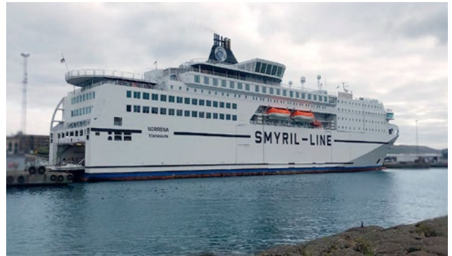
Siglingin með Norrænu, frá Seyðisfirði til Þórshafnar, fór vel með hópinn.

Góður andi var í hópnum þegar siglt var frá Seyðisfirði og lofaði það góðu fyrir komandi daga. Siglingin gekk að óskum, með afþreyingu upp á gamla mátann. Net í gegnum gervihnött er frekar dýrt um borð í Norrænu svo það var tekið í spil til að styttja sér stundir eða jafnvel bara talað við náungann. Einnig var möguleiki á að fara í pottinn, sund, ræktina eða bíó, svo eitthvað sé nefnt.