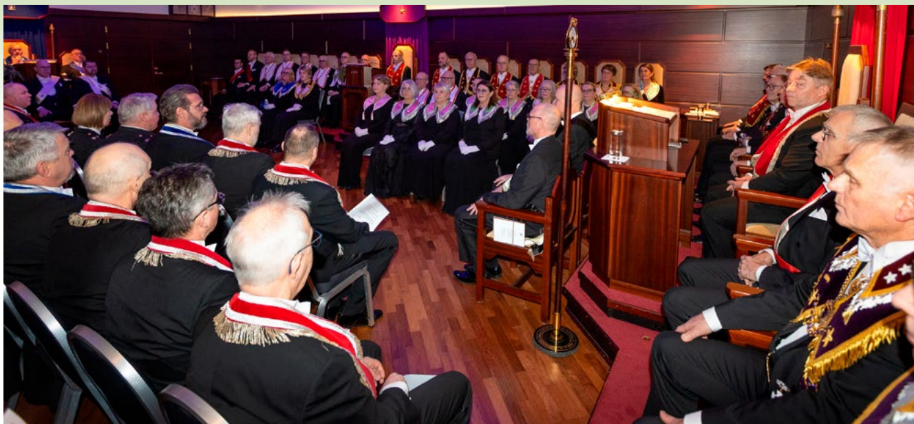
Um 100 manns sóttu hátíðarfund og –samkomu í tilefni af 50 ára afmæli Njarðar í Keflavík.

með hófst nýr kafli í sögu stúkunnar og brautin breiða og slétta breikkaði enn fyrir komandi kynslóðir.