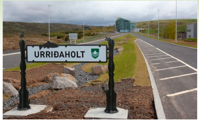
Hús Náttúrufræðistofnunar Íslands var fyrst til að rísa í Urriðaholti. Hefur verið leigt af Oddfellow.