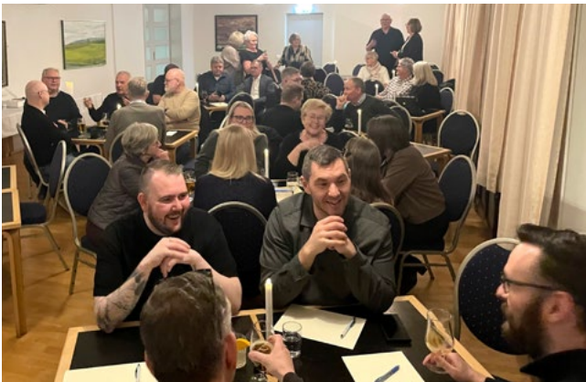
Mikil spennan var í salnum þegar pöbbkvíssið fór fram.

föstudaginn 25. september næstkomandi. Bræður og systur fá því ágætan tíma til að æfa sig og mæta enn sterkari og fjölmennari til leiks.