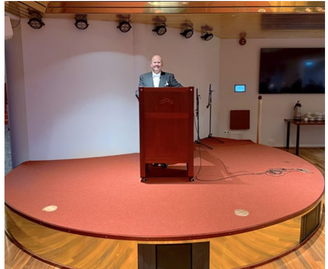
Nýtt og rýmra svið á nýjum stað í samkomusalnum.

neyðarstiga og palla og setja upp handrið. Í lok sumars var búið að ganga endanlega frá þökum og þakköntum. Þá var húsið þokapússað að utan og vatnsbretti steyppt þar sem við á og stéttir steyptar. Þar sem hraunun veggja var ekki lokið fyrr en síðla hausts var ekki unnt að mála utanhúss.