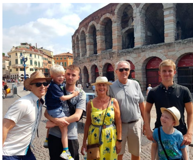
Frá fjölskylduferð til Verona á Ítalíu.

Ég á mér draum, þann dag hef ég þráð að dætur og synir þeim stað hafi náð, hvert hörund sem ber, óháð hóp eða stétt, muni horfast í augu og skynja hvað rangt er og rétt.