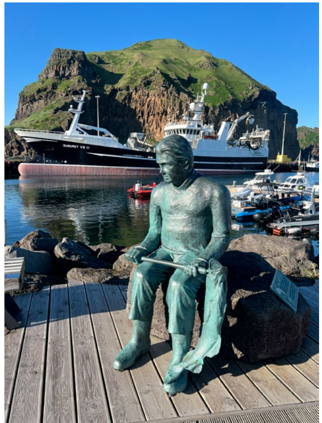
Fast hafa þeir sótt sjóinn frá Eyjum, hér siglir Suðurey VE inn höfnina.