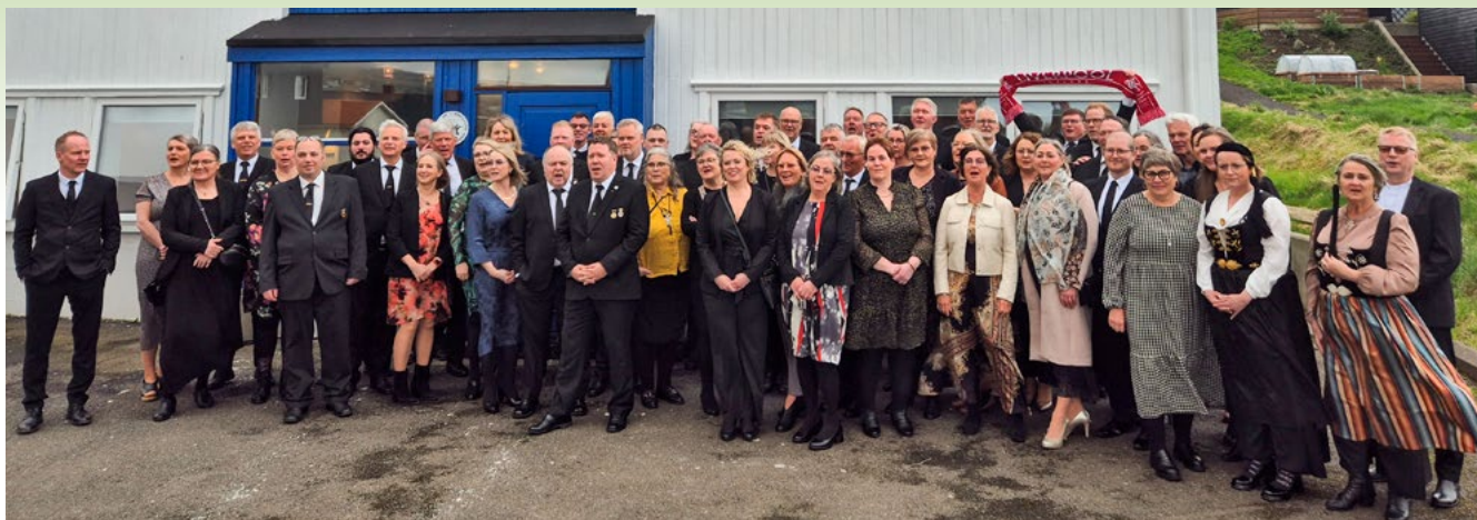
Íslenski hópurinn frá Austurlandi, bræður og makar, við regluheimili Oddfellowa í Þórshöfn.

hópurinn kátur. Sumir meira að segja voru svo kátir að gerð var atлага að því að mála bæinn rauðann.