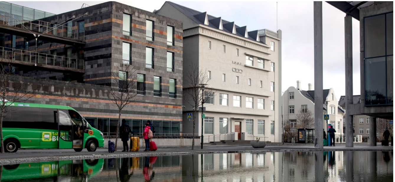
Oddfellowheimilið að Vonarstræti, til hægri, við hlið nýbyggingu Alþingis, Smiðju.