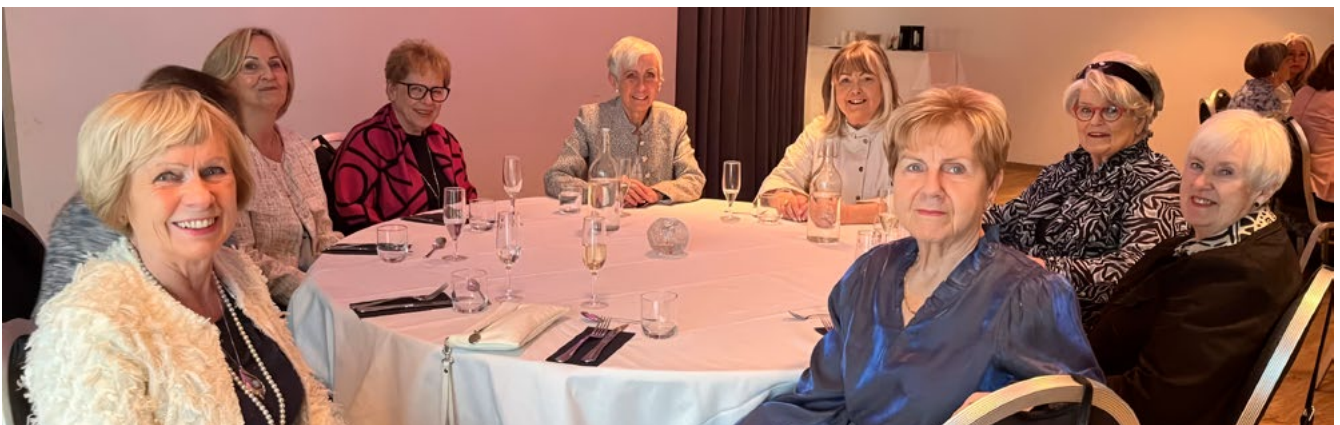
Eldri systur úr Bergþóru á góðri stund saman í hádegisverði í boði systra sinna. Árlegur viðburður í marsmánuði.

Höfundur: Ingibjörg Ólafsdóttir, Rbst. nr. 1, Bergþóru